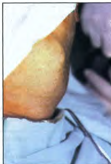
Fig. 1- Tumefacção da região submandibular

À observação apresentava tumefacção com aproximadamente 5 cm de diâmetro, nas regiões submentoniana e laterocervical direita adjacente, com elevação do pavimento bucal anterior, indolor, de consistência elástica, sem aderência aos planos subjacentes (Fig. 1). Não se palpavam adenopatias nem outras massas anormais.