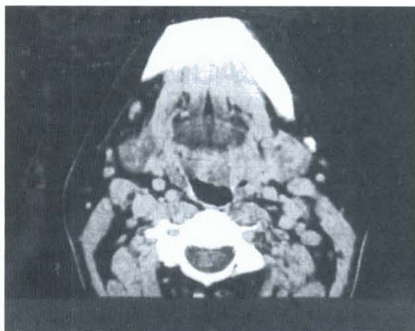
Fig. 2 - TAC do pavimento da boca

A Tomografia Axial Computadorizada (TAC) revelou uma massa com conteúdo líquido e um grande componente sólido (Fig. 2 e 3).