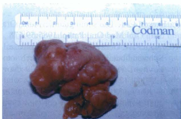
Fig. 7 - Peça operatória.