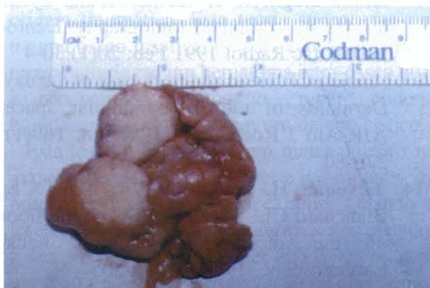
Fig. 8 - Aspecto interior da peça operatória