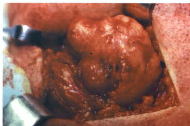
Fig. 5 - Aspecto per-operatório. Dissecção.