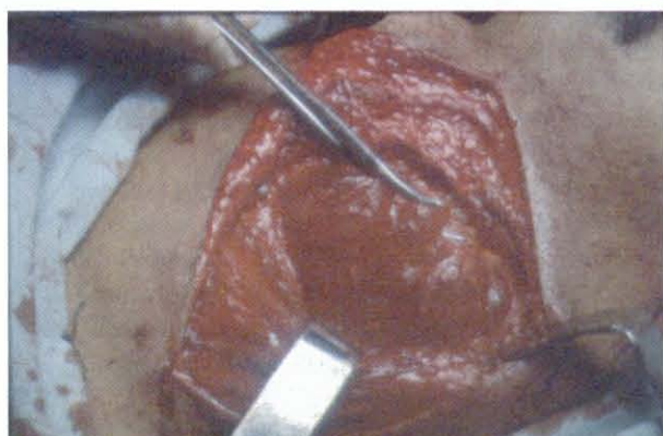
Fig. 4 - Aspecto per-operatório. Abordagem submentoniana

O diagnóstico clínico de quisto dermóide foi confirmado pelo exame anatomopatológico após a exérese realizada sob anestesia geral (Fig. 4 a 8).