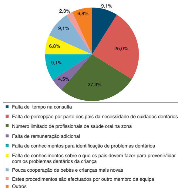
Figura 2 – Obstáculos à realização dos procedimentos preventivos (n = 44).

informação sobre a prevenção de doenças orais foram, por ordem decrescente, os médicos de família (27,0%), os enfermeiros (25,0%), os médicos dentistas (23,0%) e os pediatras (23,0%). Na alínea «outros» (2,0%) foram referidos os higienistas orais e os professores das escolas e jardins-de-infância.